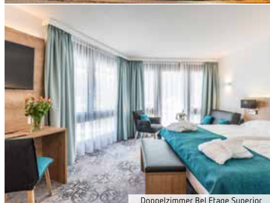
Doppelzimmer Bel Etage Superior