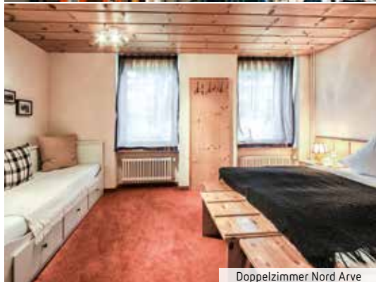
Doppelzimmer Nord Arve

Ferienhotel mit ungezwungener Ambiance. Tagsüber kann man in der Lounge bei Jazzklängen Kaffee trinken und abends lässt sich es hier stilvoll kuscheln, lachen und flirten.