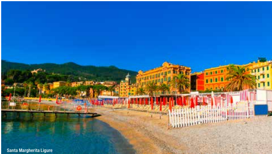
Santa Margherita Ligure