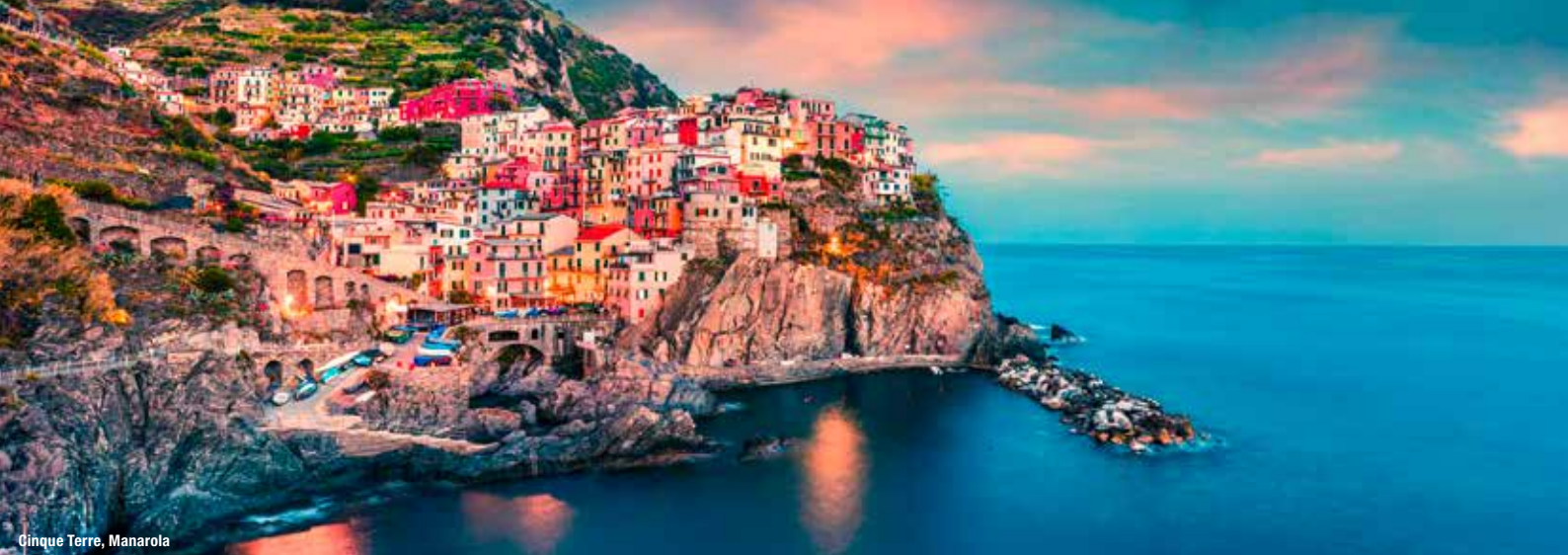
Cinque Terre, Manarola