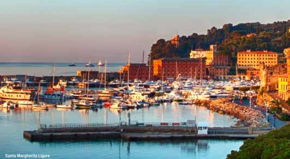
Santa Margherita Ligure