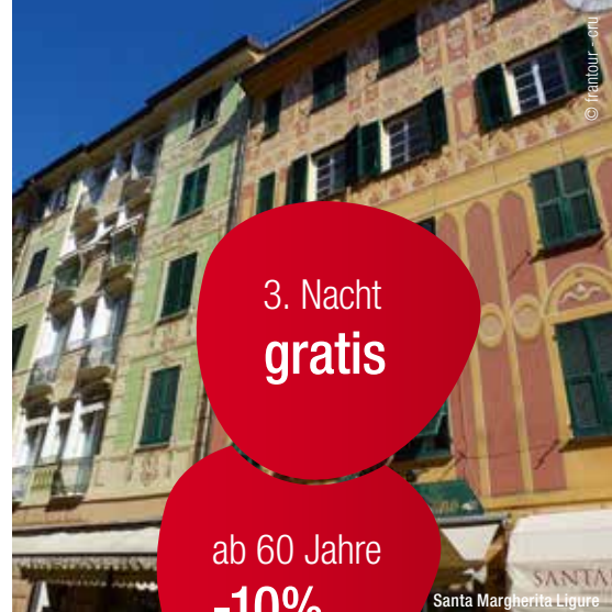
Santa Margherita Ligure